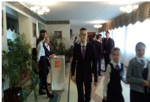
Схема органов ученического самоуправления в лицее представляет собой взаимосвязь всех структур учащихся лицея. Во главе Школьного Совета лицеистов (ШСЛ) находится Совет министров, в который входит Спикер лицея и Главные министры из числа учащихся 5-11 классов. Главные министры ШСЛ возглавляют министерства: